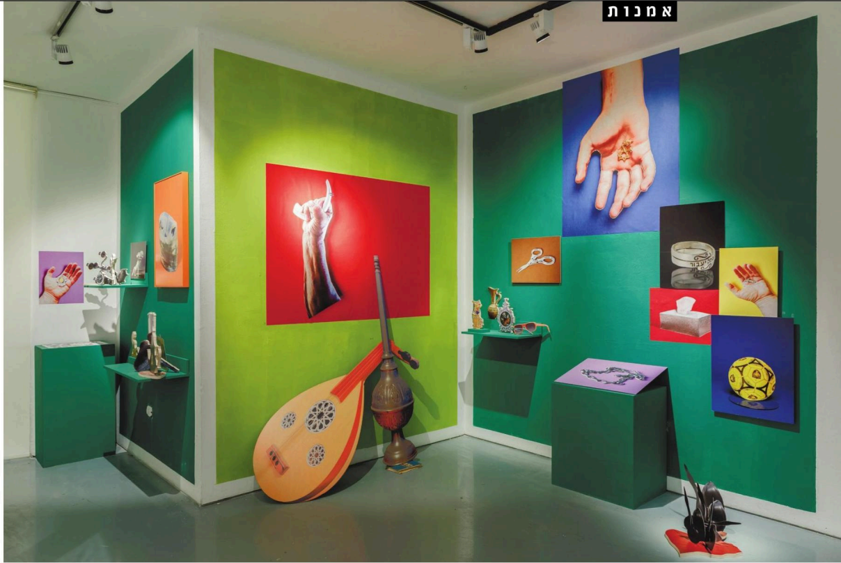
ציקי אייזנברג, "אי המטמון", 2025.