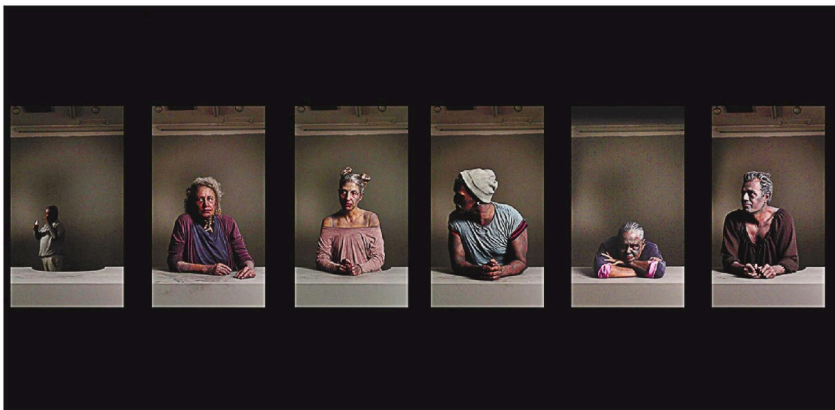
אוריית אדר בכר, "האבודים", 2025.

זילברמן צילם את הדוגמאות בשונות של סורגי ברזל ישנים בשכונה והפך אותם למגורות נייר תלויות. תיאטרון הצללים שמטיילים המוביילים העדינים על הקיר מדמה את המבט החולף, המרצד מבעד לסורגים. התצלום הגדול "אריג" מכיל שכבות של תצלומי סורגים שהונחו זה על גבי זה,